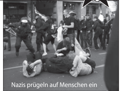
Nazis prügeln auf Menschen ein

In den Unterlagen des FBI finden sich unter anderem Dokumente, die angeblich beweisen, dass John Lennon z.B. 46.000 Pfund an verschiedene linke Gruppen